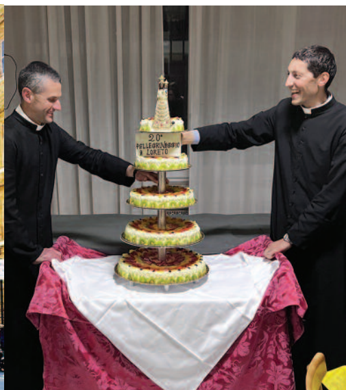
Pellegrinaggio a Loreto: foto di gruppo e la torta del ventennale