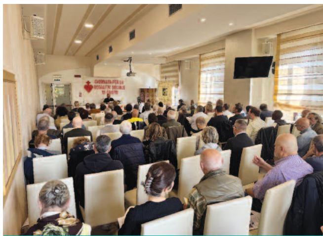
XVIII giornata per la regalità di Cristo