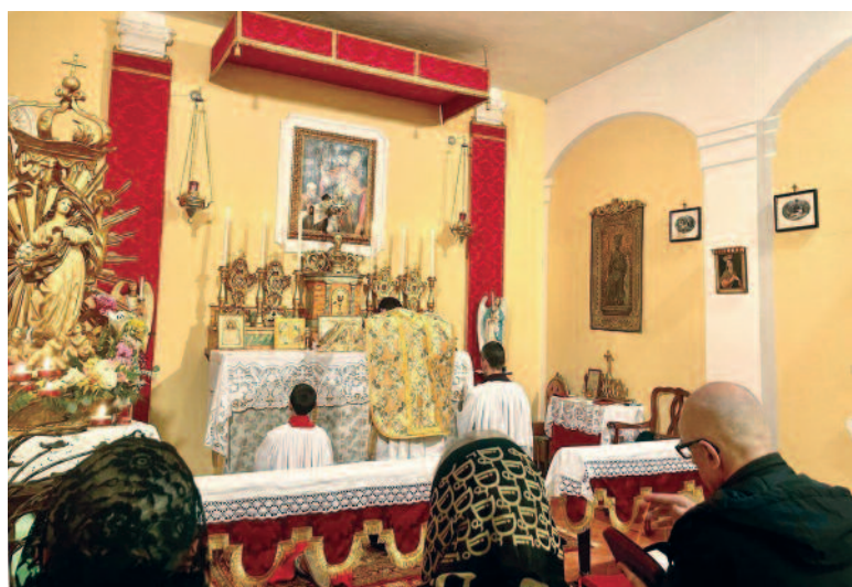
S. Messa pasquale all'oratorio di Rimini

A Roma, Potenza e Modugno la mia presenza era limitata ad una Messa mensile, per cui i confratelli hanno continuato l'apostolato nei vari oratori, con l'aggravio di viaggi supplementari. Rimaneva il problema dei sacramenti ai malati che è stato risolto nel migliore dei modi da don Bernard, intraprendendo a