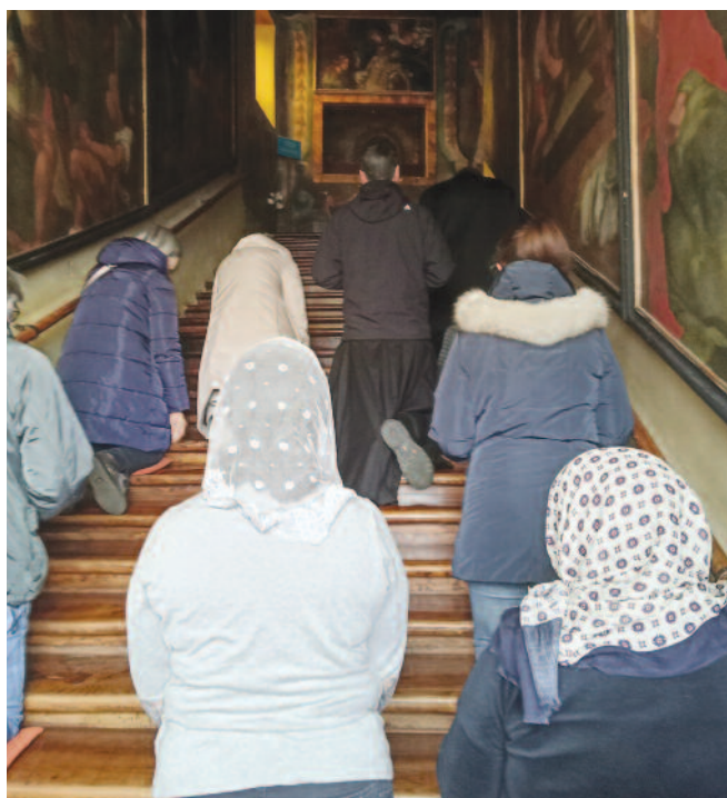
La Scala Santa di Campli