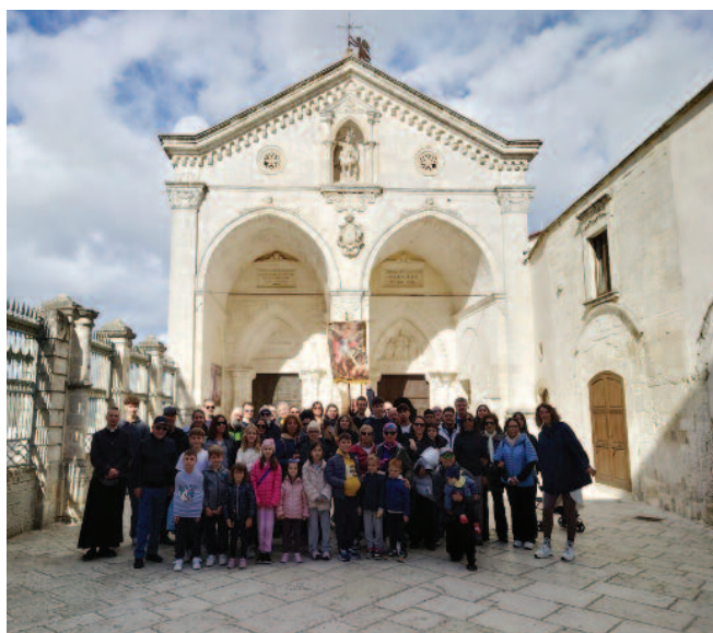
Pellegrinaggio a Monte S. Angelo