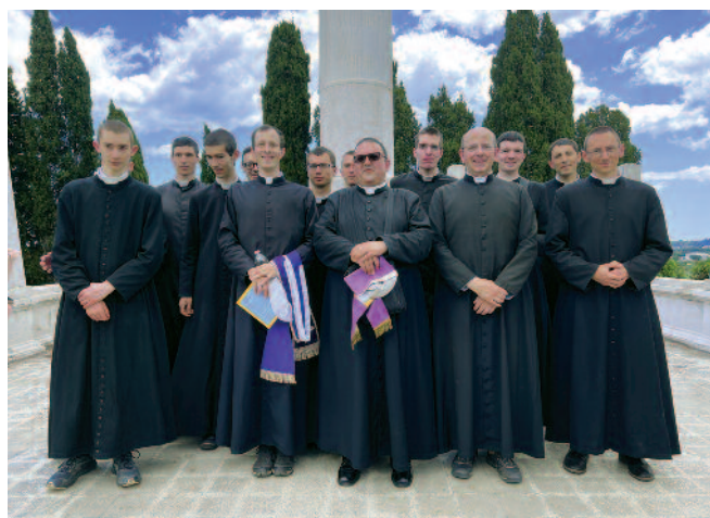
Le "talari" presenti al pellegrinaggio di Loreto