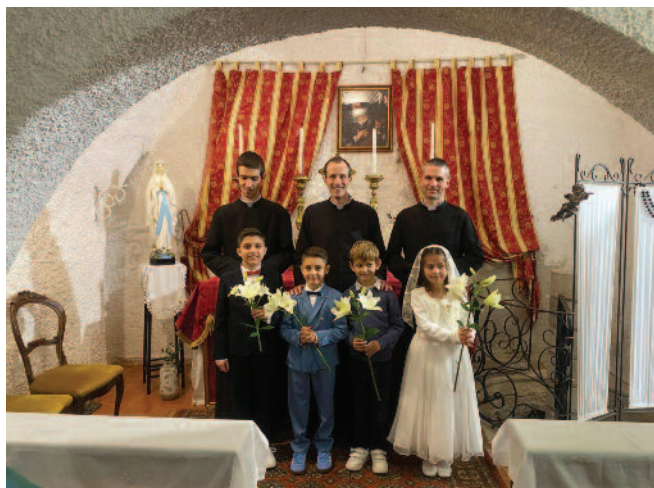
Prime Comunioni a Modugno (BA)