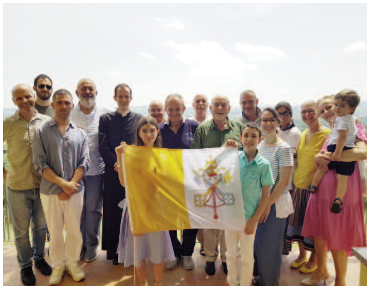
Foto di gruppo dopo il pranzo papalino