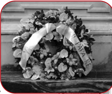
Cimitero del Verano: il ricordo dei soldati di Pio IX