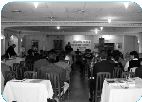
Modena: due momenti della giornata per la Regalità sociale di Cristo

Defunti - 12 luglio 2006, all'Opera Pia Mastai Ferretti di Senigallia, si è spento Mons. Angelo Mencucci. Nato il 1° ottobre del 1914 a Corinaldo, ordinato sacerdote il 12 marzo 1938, dal 1954 canonico del Capitolo della Cattedrale di Senigallia e dal 1966 parroco della stessa Cattedrale, per molti anni è stato direttore del Museo Pio IX, presso il Palazzo Mastai. Uomo di profonda cultura, figura sacerdote diamantina, estimatore del rito tridentino della Messa, con la sua dedizione e preparazione ha contribuito notevolmente allo studio e alla divulgazione della vita di Pio IX. R.I.P.