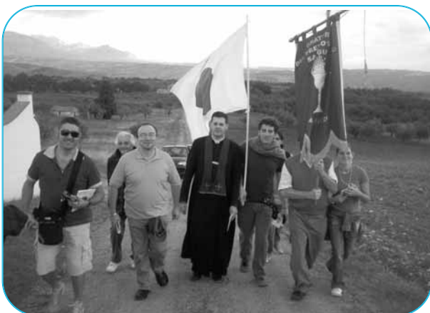
Pellegrinaggio a Manoppello: un drappello di pellegrini in marcia