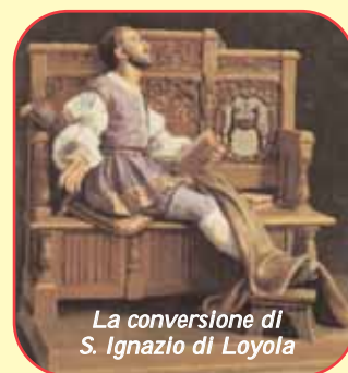
La conversione di S. Ignazio di Loyola

Tel.: 0161. 83.93.35 - Fax: 0161. 83.93.34 - email: info@sodalitium.it